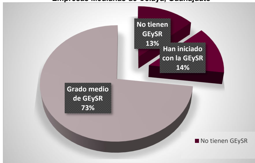
Figura 1. Desarrollo de la Cultura de la Gestión y Ética y Socialmente Responsable en las Empresas Medianas de Celaya, Guanajuato

En las empresas medianas de Celaya, Guanajuato, se observa en la Figura 1, que la mayoría de las empresas medianas tienen un grado medio de DCGESREM 73%, el 14% han iniciado con la cultura de gestión ética y socialmente responsable pero el 13% no han iniciado con la DCGESREM. Cabe señalar que ninguna empresa mediana contemplada en este estudio cumple totalmente con las actividades de DCGESREM que establece la Norma SGE 21.