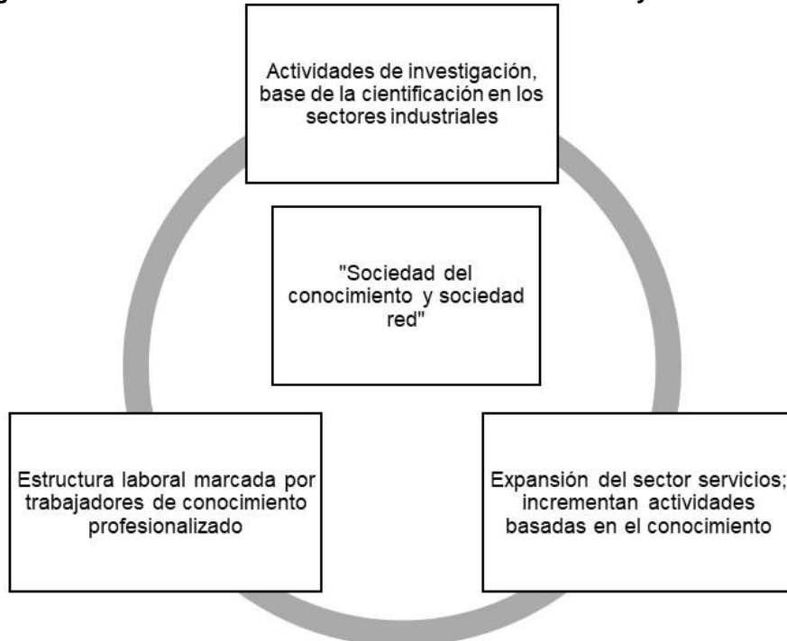
Figura 1: Características de la sociedad del conocimiento y la sociedad red.