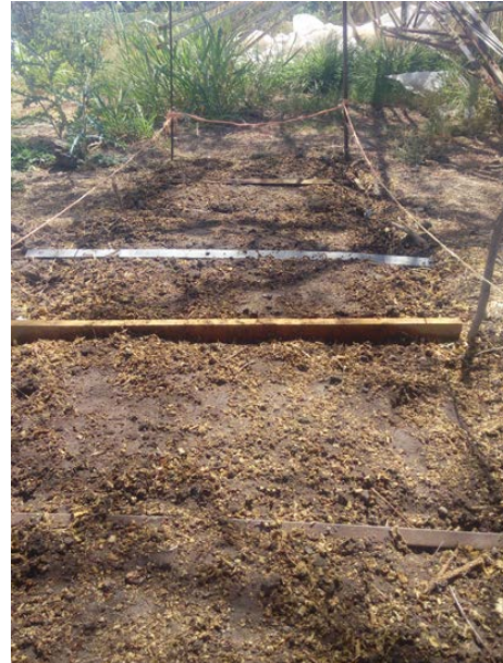
Figura 3 Primer riego de maíz criollo en ITR.

Se realizó el diseño total del plano de los bloques en una bitácora para la recopilación y obtención de datos del ITE. El diseño experimental propuesto se muestra en la tabla 1, donde X es el bloque 1 con una humedad al 100% de humedad, Y es el bloque 2 con una humedad al 75%, Z es el bloque 3 con una humedad al 50%. N representa la semilla de color negro y B la semilla color blanco.