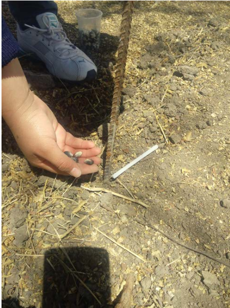
Figura 2 Siembra de maíz criollo en ITR.

Se empleó un diseño experimental en un bloque con tres repeticiones, En cada repetición se agregaron 42 semillas con una distancia entre plantas de 10 cm y una profundidad de 5 cm (figura 2 y 3).