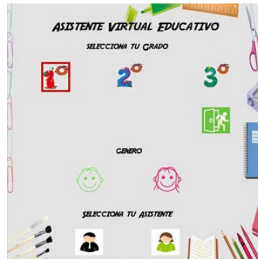
Figura 2 Ventana principal al ejecutar el tutor virtual.

género del tutor virtual. La animación de audio y voz en cada imagen GIF se sincronizan para denotar una mejor naturalidad durante la interacción con el estudiante. Uno de los aspectos más destacados en el diseño del tutor virtual educativo es la interacción hombre-máquina, con un diseño atractivo para captar la atención de los estudiantes, logrando una relación natural efectiva en tiempo real. Para implementar el prototipo e iniciar sesión en el tutor virtual, se usó un esquema de navegación simple, amigable, lúdica e intuitiva entre ventanas como interfaces gráficas de usuario. La figura 2 muestra la ventana principal cuando se ejecuta el tutor virtual, donde se les pide a los estudiantes que indiquen su grado, género y tipo de tutor virtual que prefieren para interactuar.