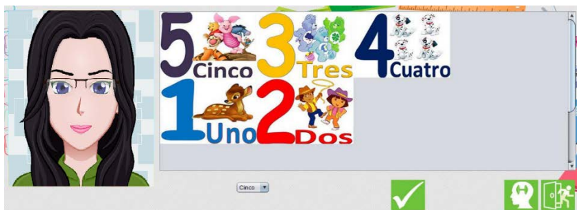
Figura 7 Ventana para iniciar un ejercicio de refuerzo de los números del 1 al 5.

La figura 7 muestra un ejemplo de un ejercicio de refuerzo, el cual es usado en la materia de matemáticas para evaluar el aprendizaje de los números del 1 al 5.