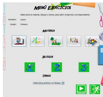
Figura 6 Ventana del menú de ejercicios según cada tema.