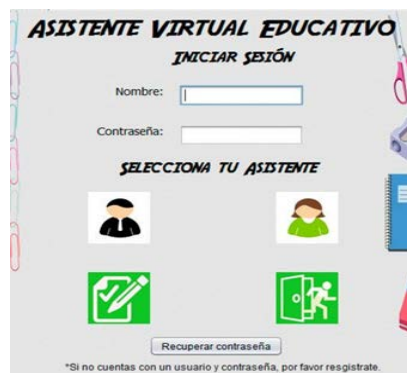
Figura 3 Ventana de inicio de sesión con el tutor virtual.

En la figura 3, se muestra la ventana para iniciar sesión. Es necesario que todos los estudiantes estén registrados para poder iniciar sesión con el tutor virtual. La ventana de registro se muestra en la figura 4.