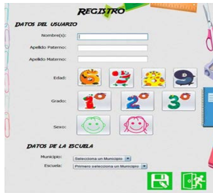
Figura 4 Ventana de registro de alumnos para iniciar sesión con el tutor virtual.

Cuando un estudiante está conectado, se muestra una ventana de bienvenida (ver figura 5). Una vez que el alumno ha iniciado una sesión, debe elegir en cada asignatura, el bloque y el tema en los que desea obtener información de repaso, para así aceptar el desafío de responder correctamente a un ejercicio de refuerzo. Esta elección se realiza desde la ventana que se muestra en la figura 6.