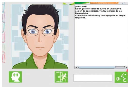
Figura 5 Ventana de bienvenida de un estudiante al iniciar sesión con el tutor virtual.

Cuando un estudiante está conectado, se muestra una ventana de bienvenida (ver figura 5). Una vez que el alumno ha iniciado una sesión, debe elegir en cada asignatura, el bloque y el tema en los que desea obtener información de repaso, para así aceptar el desafío de responder correctamente a un ejercicio de refuerzo. Esta elección se realiza desde la ventana que se muestra en la figura 6.