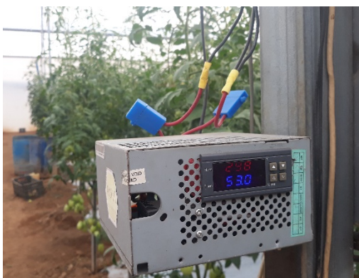
Figura 7 Transmisión de señales.

Se midió la humedad relativa del aire con el sensor htu21d, el cual arrojo una humedad relativa considerada ideal entre 60-70%, se puede observar también en este caso la excelente calidad del aire que se presenta en la figura 7.