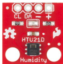
Figura 5 HTU21d.

El componente principal utilizado en el sensor digital de humedad y temperatura htu21d visible en la figura 4, es el amplificador ad8232 de la compañía Analog Device, dicho dispositivo tiene integradas las funciones de: compensación, filtrado y amplificado de la señal adquirida, características necesarias y requeridas al momento de hacer el monitoreo en tiempo real de la temperatura y humedad en el invernadero, para su envío al sistema de control y poder tomar una acción correctiva en caso de requerirse [Cid, 2015].