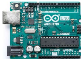
Figura 1 Arduino Uno.

El sistema de desarrollo Arduino uno de la figura 1 es una tarjeta pequeña, completa y fácil de usar basada en el microcontrolador ATmega 328p, el Arduino Uno puede ser alimentado eléctricamente de diferentes formas: mediante un cable mini USB (USB Plug) o una fuente de alimentación externa de 5 V (External Power Supply) [Cid, 2015].