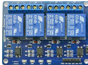
Figura 3 Modulo de 4 relevadores.