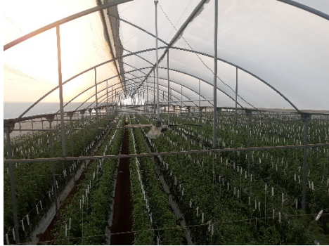
Figura 2 Extractor de vórtice de rotación invertida.

acciona el extractor de calor en grupos de cinco, tiene que ser una prioridad y estar siempre presente para evitar daños o problemas de funcionamiento.