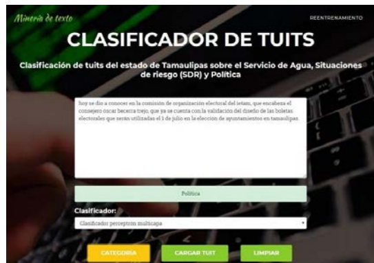
Figura 7 Categoría asignada por el clasificador.