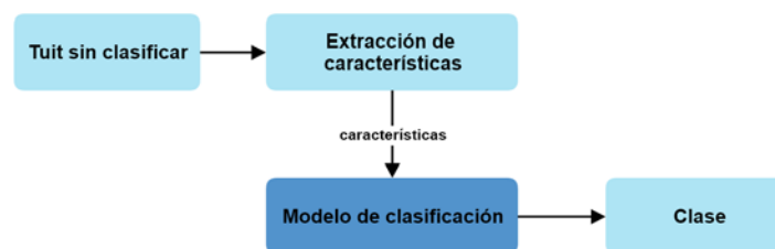
Figura 4 Proceso de predicción para los tuits de prueba.

Una vez entrenado el clasificador, se realizan las pruebas, es decir, se recibe un tuit sin clasificar el cual pasa por una etapa de extracción de características y posteriormente se hace la consulta al clasificador para obtener su etiqueta o clase. Este proceso se muestra en la figura 4.