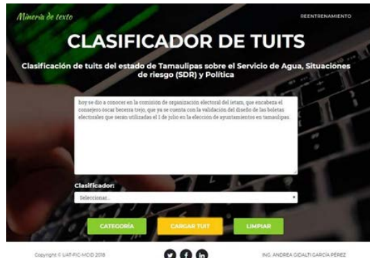
Figura 6 Botón para cargar tuit aleatorio.