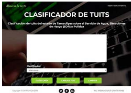
Figura 5 Vista principal de la interfaz para usar el clasificador.