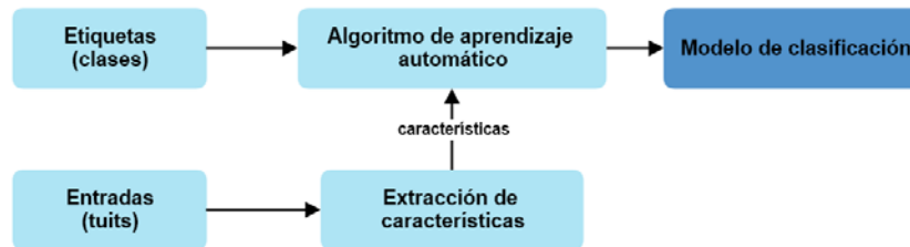
Figura 1 Proceso de extracción de características.

modelo bolsa de palabras se toman todos los textos de la colección, en este caso todos los tuits recuperados y se obtiene el vocabulario, es decir todas las palabras que aparecen en el conjunto (sin repetición). Posteriormente, cada tuit se representa como un vector en donde cada palabra tiene una ponderación.