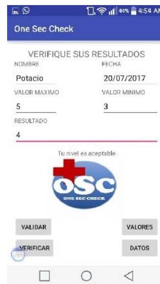
Figura 3 Validación de la Prueba.