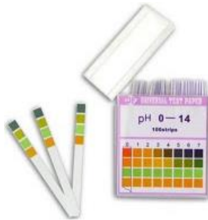
Figura 4 Cintas de PH.

Por otro lado, la muestra de pacientes fue seleccionada del municipio de Tekax, las características de estas personas primeramente que padezcan alguna enfermedad como es diabetes, colesterol, triglicéridos, entre otros; para poder aplicar la muestra de sangre y la app. Para ello el rango de pacientes fue de 25 a 50 años, debido a que estos son los más propensos debido al estilo de vida; Tekax cuenta con 33 923 habitantes, en donde el 56.8% de estas personas padecen diabetes y son mayores de 35 años.