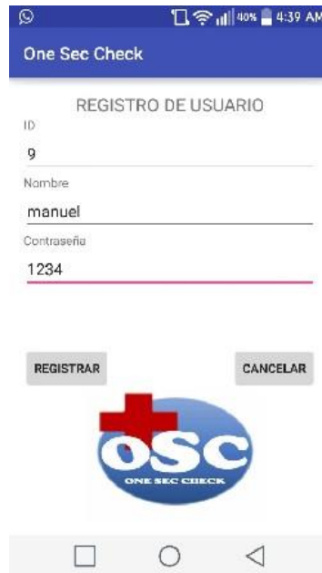
Figura 1 Registro de Usuario.

muestra en la figura 1, en donde se puede apreciar como el usuario se va registrando en la aplicación.