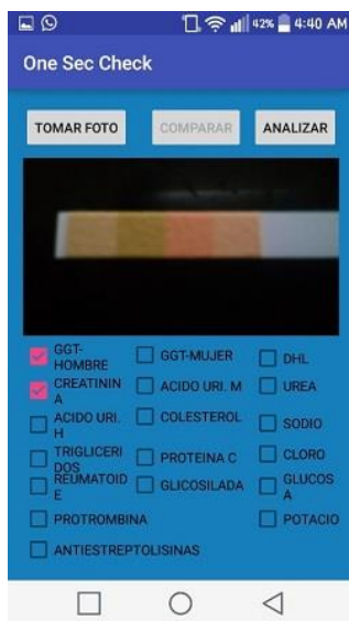
Figura 2 Selección y validación del PH.

En la actualidad el aporte de la tecnología es fundamental en todas las áreas ya que el manejo de los equipos médicos de alta complejidad es parte de los avances tecnológicos que se han venido efectuando a través del tiempo. Por lo que al implementar la app en el laboratorio BIOLap se aplicaron 10 muestras a pacientes tanto en sangre como con la aplicación; en este caso la variante de las muestras realizadas fue que una prueba sale errónea lo que quiere decir se tiene un 90% de confiabilidad en los estudios realizados. Como se muestra en la figura 2, donde se está realizando la prueba. Y en la figura 3 se puede observar el resultado de la validación; por otro lado, en la figura 4, se puede observar las cintas de PH, que se usan para realizar las muestras de orina.