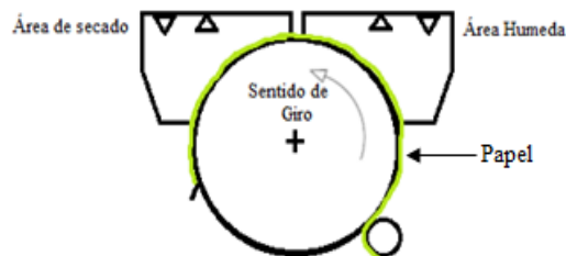
Figura 3 Cilindro de secado de papel basado en la propuesta original.

Amador-Mendoza et al. (2011) muestra un modelo referente al proceso de secado empleando flujos de aire revertido es decir que el flujo de aire es cambiado de derecha a izquierda o viceversa.