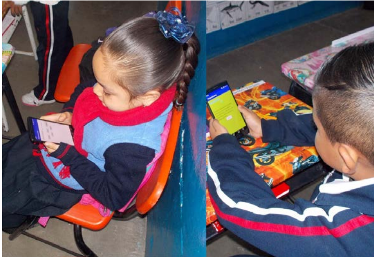
Figura 3 Niños utilizando la app.

hicieron uso de la aplicación previamente desarrollada. El tiempo que el estudiante manejo el software fue solamente de dos semanas, en la figura 3 se muestra a dos de los niños utilizando la app.