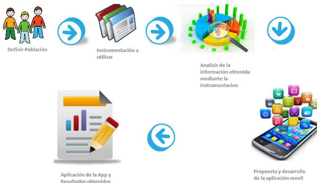
Figura 1 Metodología empleada en el proceso de investigación.

alumno logre concretar el aprendizaje. Se utilizó una encuesta encaminada hacia los profesores exclusivamente de primero y segundo grado, con la finalidad de indagar las posibles causas que inciden en que el alumno no logre -en tiempo y forma-, el aprendizaje de la lectura y la escritura y a la vez recabar información sobre las estrategias que emplean los docentes para subsanar estas carencias. Dichas preguntas abarcan desde su información docente como antigüedad, veces que ha impartido 1er grado, así como las metodologías utilizadas en el salón de clases y cuales consideran que son los factores incidentes en el proceso de adquisición de lectura y escritura en sus alumnos.