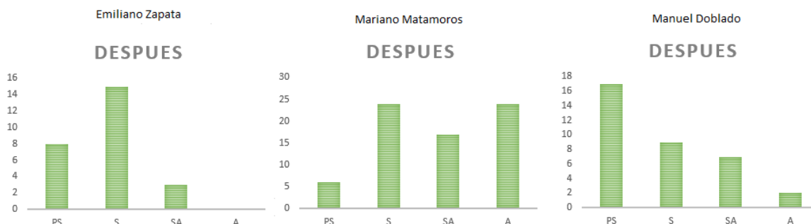
Figura 5 Niveles de lectura escritura después de utilizar la app.

En la tabla 1 se muestran los resultados de los niños en los diferentes niveles (1 Pre-Silábico, 2 Silábico, 3 Silábico-Alfabético, 4 Alfabético), de dos de las tres escuelas tomadas como referencia, la Emiliano Zapata y la Manuel Doblado, en la figura se muestra el resultado de 29 niños, con cuatro columnas, las dos primeras con los niveles obtenidos por los niños y las dos últimas el valor al cuadrado del nivel obtenido, esto es necesario para los cálculos de t-student.