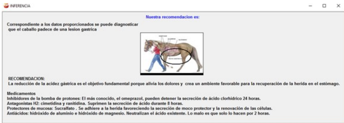
Figura 5 Pantalla de Resultados del Test de síntomas de cólicos en caballos.