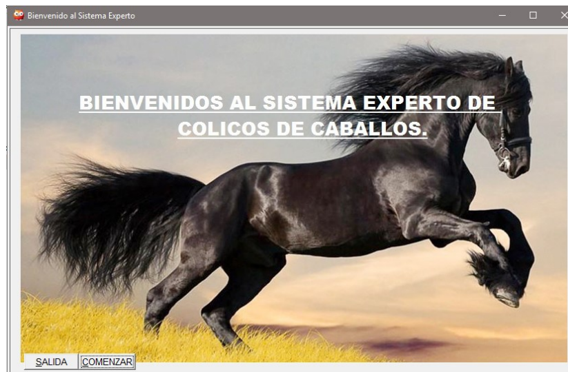
Figura 3 Pantalla principal de Sistema Experto, Identificación de cólicos en caballos.