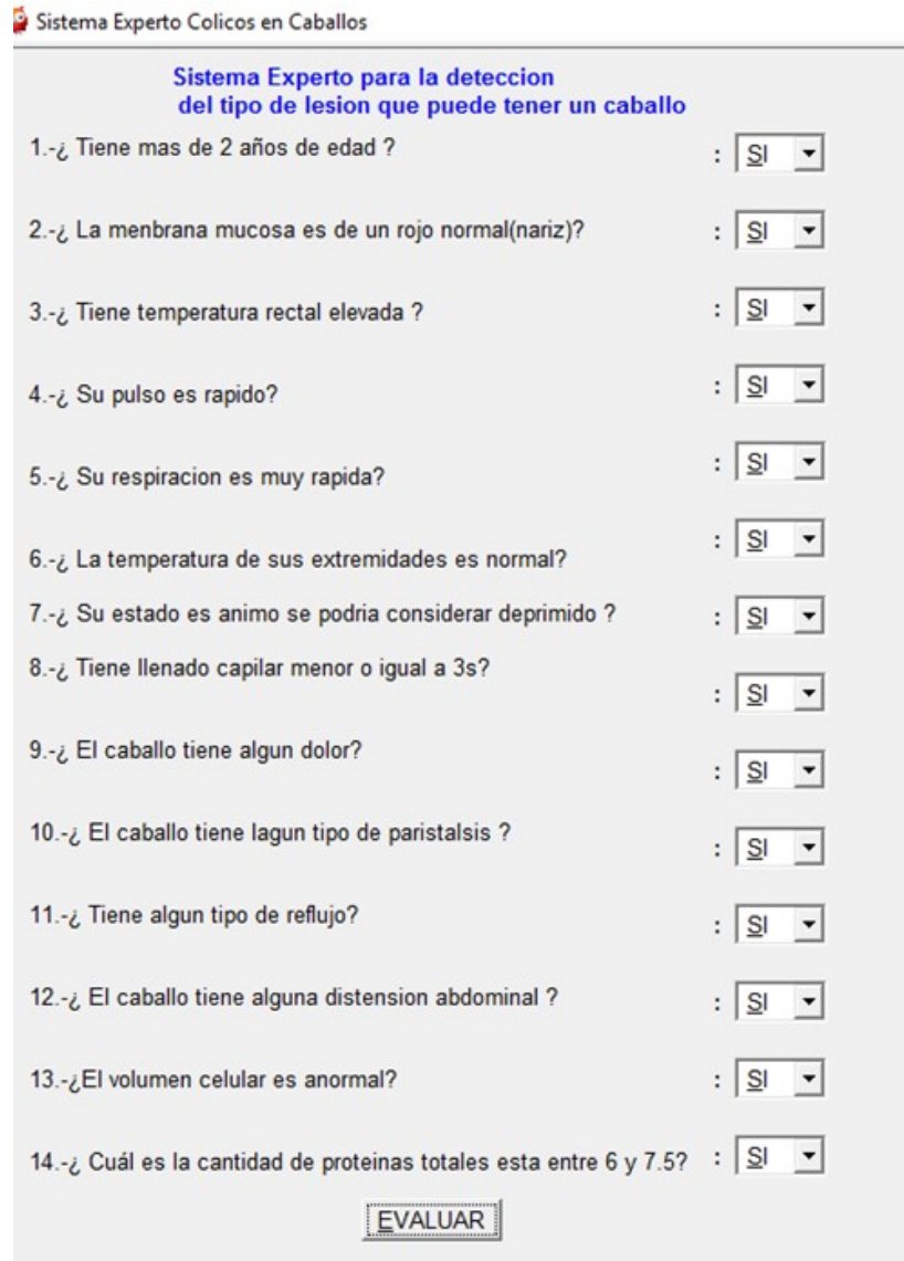
Figura 4 Cuestionario de identificación de cólico en caballo.