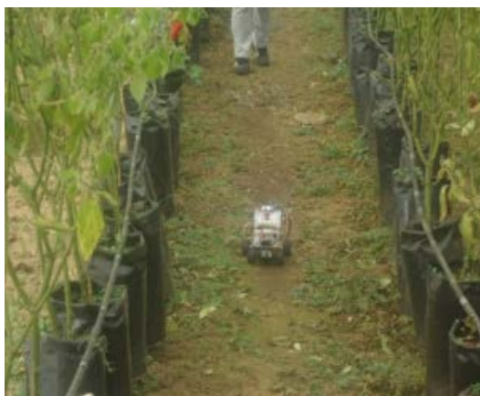
Figura 7 Prototipo dentro del invernadero.