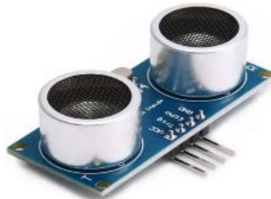
Figura 5 Sensor Ultrasónico HC-04.

El funcionamiento es sencillo, se envía un mensaje con un código para que el arduino recolecte y mande las lecturas de temperatura y humedad y las envía al número que recibió el mensaje, posteriormente se envía un mensaje para que realice alguna acción, tomar más lecturas o poner en marcha un determinado tiempo el riego para tomar nuevamente las lecturas y enviarlas al usuario.