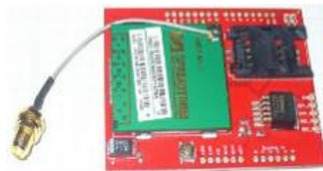
Figura 3 Tarjeta SM5100B Cellular Shield.

Otro dispositivo utilizado es la tarjeta Arduino GPRS/GSM Shield que incluye todas las piezas necesarias para conectar directamente a Arduino el módulo celular SIM900 para el envío de las lecturas puede ser muy útil utilizar este dispositivo, por ejemplo, para colocarlo en una estación meteorológica. Para este tipo de propósitos podemos utilizar un módulo GSM/GPRS con una tarjeta SIM, de forma que podamos comunicarnos con él como si se tratase de un teléfono móvil. Y es que esta tarjeta basada en el módulo SIM900 nos permite enviar y recibir llamadas y SMS y conectarnos a Internet, transformando nuestro Arduino en un teléfono móvil (Figura 3).