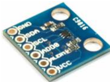
Figura 1 Sensor de Temperatura TMP102.