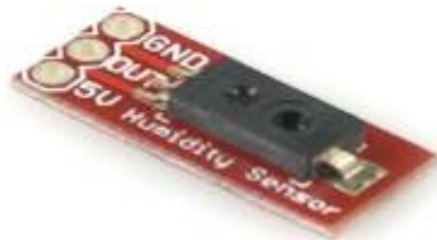
Figura 2 Sensor de Humedad HIH4030.

Otro dispositivo utilizado es la tarjeta Arduino GPRS/GSM Shield que incluye todas las piezas necesarias para conectar directamente a Arduino el módulo celular SIM900 para el envío de las lecturas puede ser muy útil utilizar este dispositivo, por ejemplo, para colocarlo en una estación meteorológica. Para este tipo de propósitos podemos utilizar un módulo GSM/GPRS con una tarjeta SIM, de forma que podamos comunicarnos con él como si se tratase de un teléfono móvil. Y es que esta tarjeta basada en el módulo SIM900 nos permite enviar y recibir llamadas y SMS y conectarnos a Internet, transformando nuestro Arduino en un teléfono móvil (Figura 3).