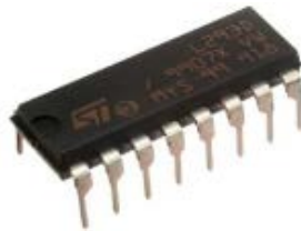
Figura 4 Puente H L293D.

Se utilizó el software libre de Arduino para realizar la programación, el control y toma de lecturas, así como la comunicación con los sensores y el módulo GSM. El control está a cargo del Arduino uno, los elementos de entrada para la recolección de datos se valida a través de sensores de temperatura, Humedad, y la interfaz del controlador y usuario se da gracias al shield GSM. Por otra parte, es importante señalar que el prototipo cuenta con un puente H L293D (figura 4), encargado de controlar los motores del prototipo y sensor ultrasónico HC-SR04 (figura 5), encargado de seguir las trayectorias dentro del invernadero [4].