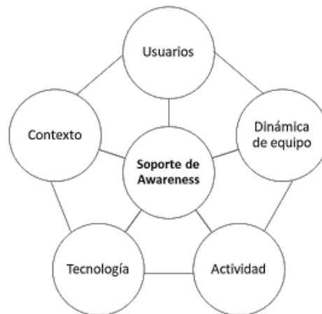
Figura 2 Modelo de los elementos a considerar para el diseño del soporte de awareness.

equipo, particularmente sus necesidades de colaboración, coordinación y comunicación; la tecnología utilizada en el SG y su contexto de uso. Este último punto involucra considerar el hardware de los dispositivos empleados por los usuarios, la red a través se establece la comunicación e intercambio de información, el diseño de la aplicación groupware y su interfaz.